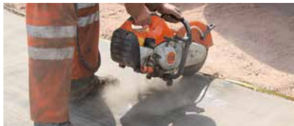
Taglio pre idratazione

Prima dell'idratazione il Concrete Canvas si presenta duttile nelle lavorazioni di taglio, molto simili alla duttilità presentata da un geosintetico tessuto ordinario. Si impiegano semplici cutter, cutter a disco per il taglio dei pannelli a misura. Una volta idratato, il materiale è tagliabile solo ricorrendo alle normali tecniche di taglio dei manufatti in cemento.