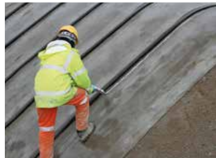
Fissaggio con sigillante adesivo