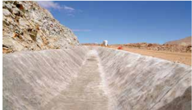
Canali e fossi di guardia