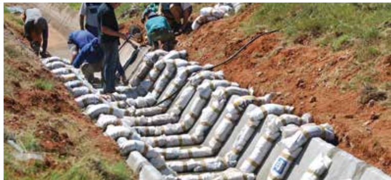
Fissaggio con zavorre provvisorie