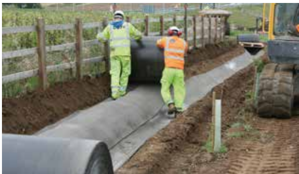
Esempio di stesa con resa di 200 mq/ora

La resa della posa è in funzione del tipo di intervento e della complessità orografica della superficie da trattare. Indicativamente, nei casi semplici, come la realizzazione di una canaletta ordinaria in rettilineo, con posa longitudinale di larghezza totale 1,10 m, utilizzando 3 operatori si ottiene una resa da 200 mq/ora. Canalette complesse, con posa trasversale di larghezza totale 2,70 m, forniscono una resa di 100 mq/giorno. L'ufficio tecnico della Harpo rimane a disposizione per fornire l'opportuna assistenza nella determinazione di questo parametro con il progetto reale.