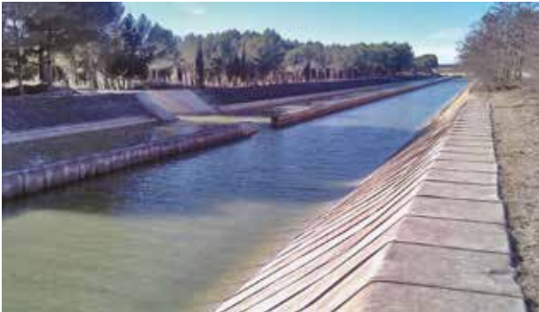
Ripristino di strutture ammalorate in cemento