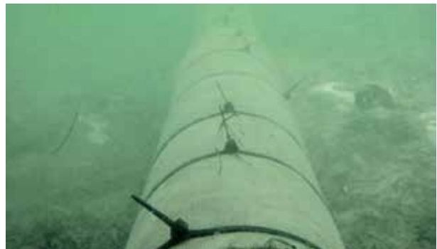
Protezione delle tubazioni immerse