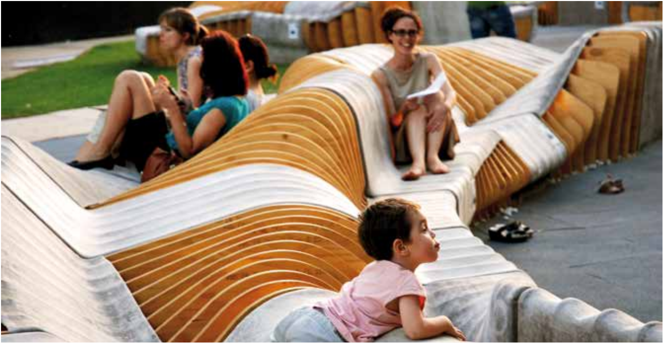
Designer: Urban Movement Design Progetto: UNIRE/UNITE Ubicazione : MAXXI Museum, Roma