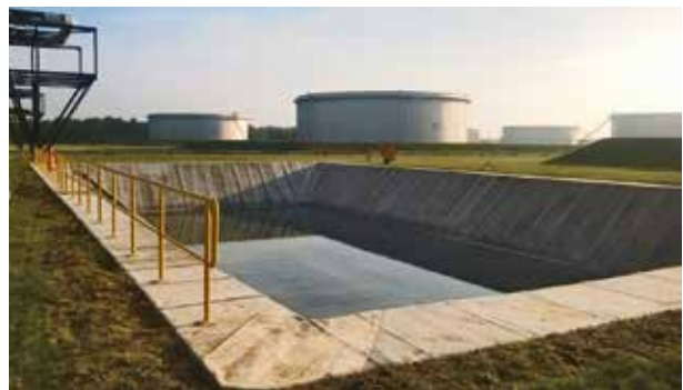
Bacini / invasi