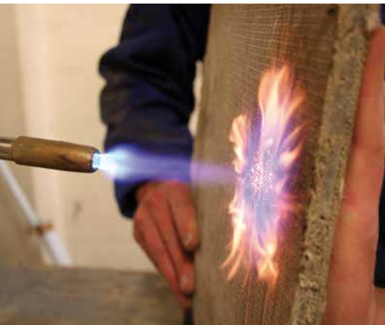
Resistenza al fuoco