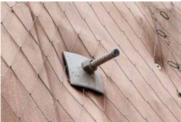
Stabilizzazione di scarpate