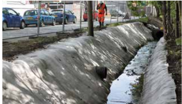
Protezione dalle nutrie