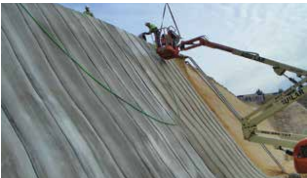
Protezione delle scarpate