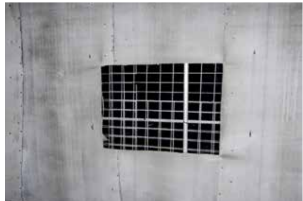
Muri di ventilazione nelle miniere