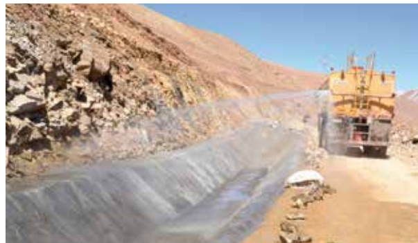
Idratazione con autobotte