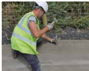
Fissaggio con picchetti