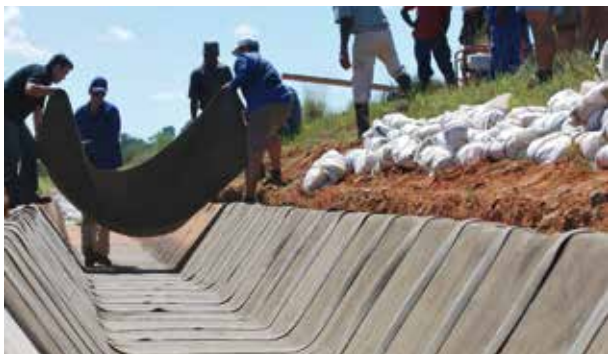
Esempio di stesa con resa di 100 mq al giorno