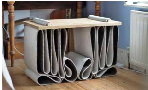
Designer: Samuel Jennings Progetto: Folded Concrete Stools Ubicazione: UK