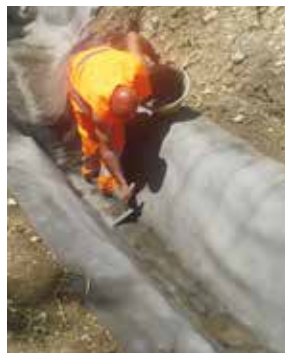
Fissaggio con boiaccia idraulica