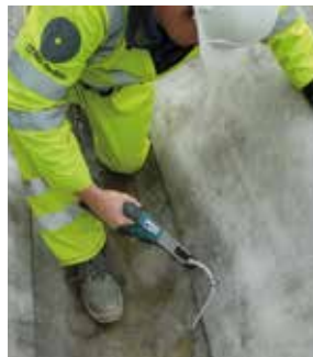
Fissaggio dei sormonti con viti inox