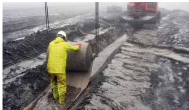
Stesa in presenza d'acqua