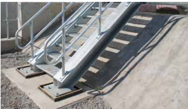
Antivegetativo e antiradice