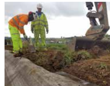
Fissaggio in trincea