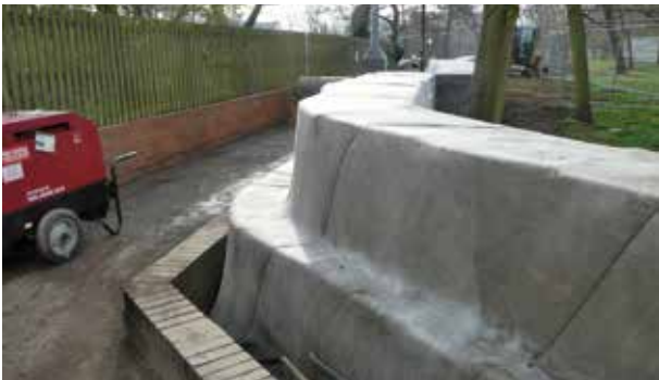
Protezione dei gabbioni